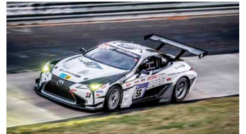
مركبة لكزس LC على حلبة نوربورغرينغ

«جازو للسباقات»، غير أن المركبة تعرضت لإصطدام بعد بدء السباق مباشرة. ومع ذلك، فقد تمكنت من مواصلة الانطلاق بقوة، حيث تمت الإصلاحات اللازمة خلال التوقف الدوري الأول في نقطة الصيانة، من دون الحاجة إلى التوقف بشكل طارئ. وفي ظل ظروف السباق القاسية وعلى امتداد ساعاته، أظهرت بعض المشاكل التقنية التي لم يكن الفريق قد واجهها خلال مرحلة الاختبار، غير أنه تم التعامل معها ومعالجتها بنجاح، وذلك بفضل احترافية وسرعة استجابة السائقين والميكانيكيين والمهندسين، الأمر الذي ساهم في عودة المركبة إلى الحلبة بقوة. واستمرت مركبة لكزس LC التي تحمل الرقم 56 في السباق منذ الساعة 6:30 صباحاً من دون أن تواجه أي مشاكل رئيسية، وتمكنت من التقدم في ترتيب السباق، لتنتج في الوصول إلى خط النهاية ونيل المركز الأول في فئة SP-PRO والمركز 96 في الترتيب العام.