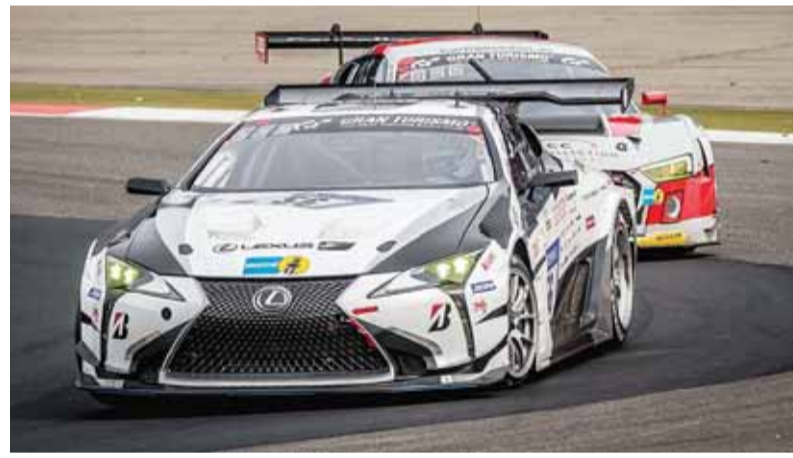
جانب من المنافسة