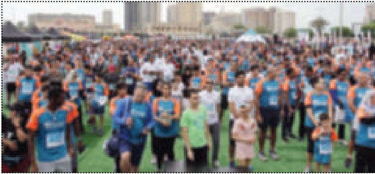
ماراثون Run الخيري السابع

أعلنت زين عن رعايتها لماراثون RunKuwait الخيري السنوي بنسخته السابعة، وهي الفعالية الصحية التي نظمتها مجموعة فوزية السلطان الصحية لصالح الأطفال من ذوي الاحتياجات الخاصة في الكويت.